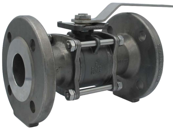
DN 15-50 PN 10-40 / WOG1000